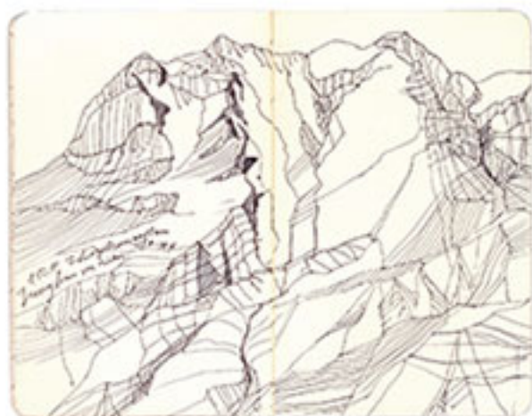
Angrau, Ledarbrunnen Valley, Switzerland — 2011