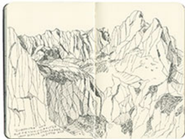
Zaportin, Hildertal, Germany — 2016