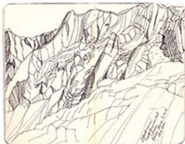
Angrau, Ledarbrunnen Valley, Switzerland — 2011